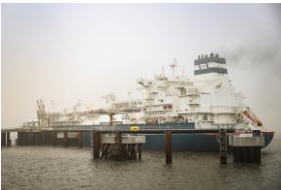
FSRU „Höegh Esperanza“